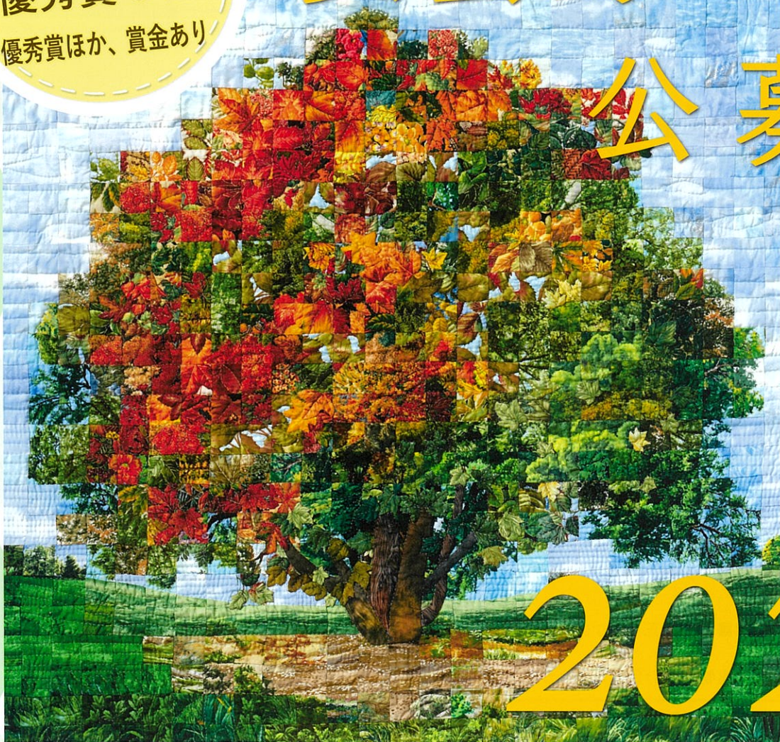
『安曇野大カエデー秋2012』平澤 由美子／当館収蔵作品